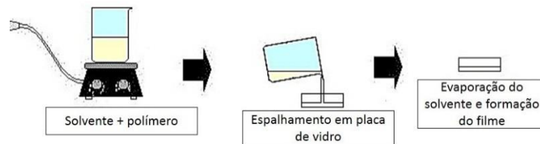
Figura 1 – Método casting .